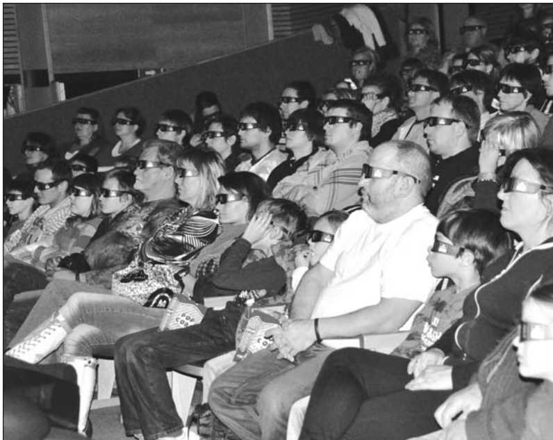
Breclavané už nemusí jezdit za kvalitním obrazem a zvukem do Brna. Breclavské kino nově nabízí i 3D filmy.

Úřad vlády ke konci roku schválil takzvaný Generel bezbariérovosti, díky kterému by chodníky ve městě mohly být časem dostupné všem. Radnice může začít žádat dotace na jejich opravu.