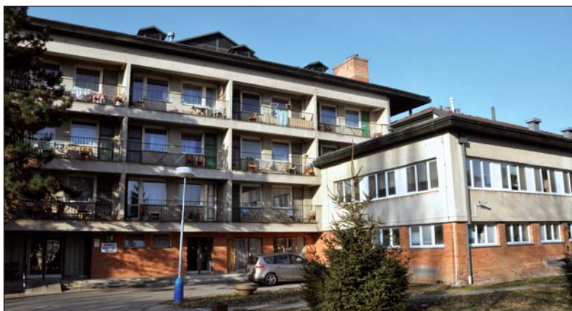
Domov seniorů se letos kompletně zateplí a bude mít nová okna.

„Ekologická stopa je souhrnný ukazatel vlivu města na životní prostředí. Ukazuje množství a rychlost spotřeby přírodních zdrojů a produkce odpadu. Ekostopa se pak porovnává se schopností přírody odpad pohlcovat a vytvářet nové zdroje,“ vysvětlila podstatu projektu Jitka Létalová z odboru životního prostředí breclavské radnice.