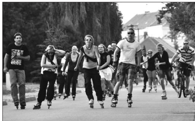
V létě si na své přišli sportovci, když město uspořádalo vyjíždky v ulicích na in-line bruslích.