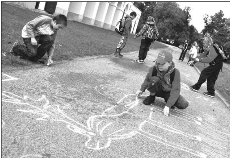
Pro breclavské školáky připravilo město ve spolupráci s Lesy ČR zajímavou expedici do lužních lesů, kterou poté doplnila výstava výtvarných prací z akce.

Konala se také revize dětských hřišť a následovat bude jejich oprava či případně dobudování nových. Uzavřený je v současné době skatepark kvůli bezpečnosti. Radnice však hledá možnosti, jak jej co nejrychleji opravit.