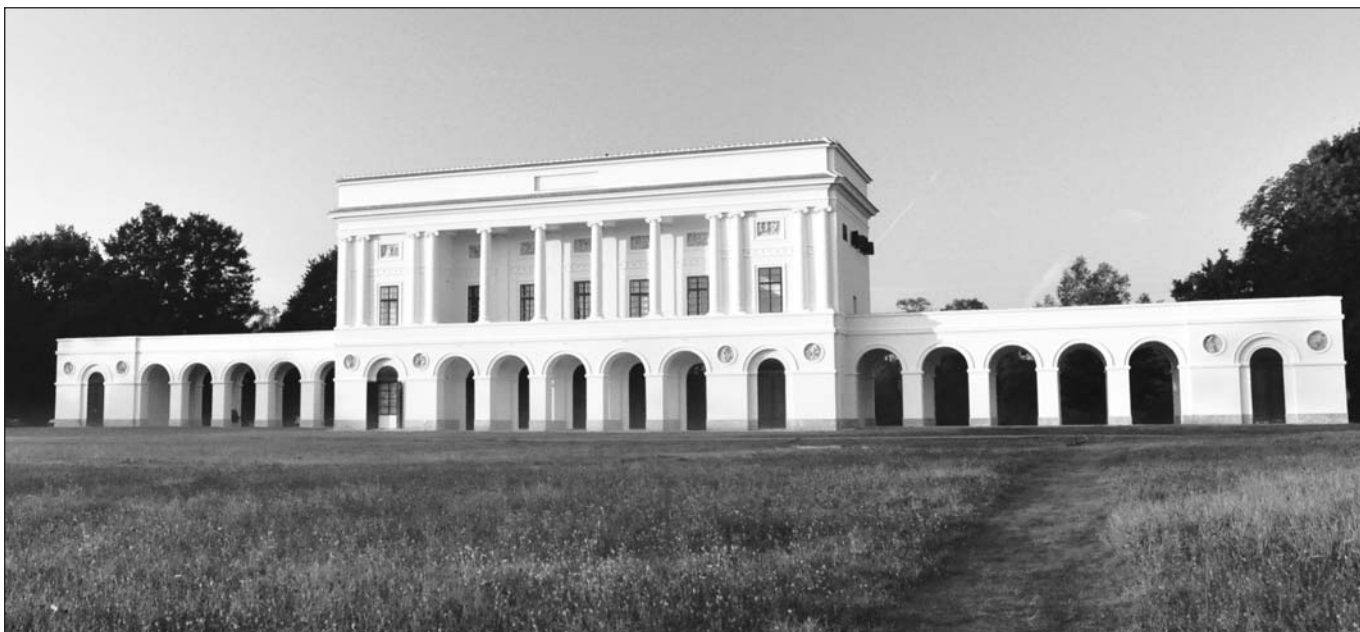
Místní i přespolní uvidí letos zámeček Pohansko v novém kabátě.

dotaci se také podařilo digitalizovat kino Koruna. Opravené je také lávka přes Mlýnský náhon a oplocení dětského hřiště v ulici gen. Šimka. Nových stromů se dočkali lidé na náměstí Petr Bezruč díky Nadaci ČEZ a úpravy mají za sebou i Na Valtické.